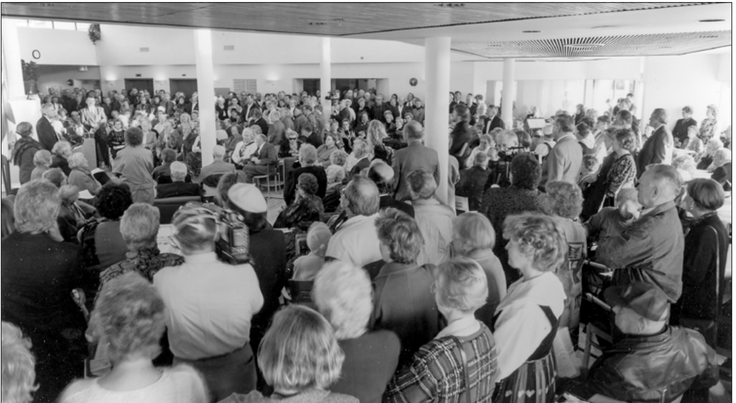
FH Grand Opening Attendees

Yhdistys otti huomioon mahdolliset häiriöt asukkaiden ja vuokralaisten elämässä ja varmisti, että uudet omistajat (JMGHS) sitoutuivat kolmivuotiseen siirtymäkauteen minimoidakseen häiriöt osana myyntisopimusta. Yhdistys jatkoi suunnitelmia kehittää Coquitlamin projektia ja tiedotti vuonna 2016, että se oli tehnyt avaimet käteen -tyyppisen sopimuksen Intracorpin kanssa luoda edullisista asunnoista koostuva vuokrarakennus,