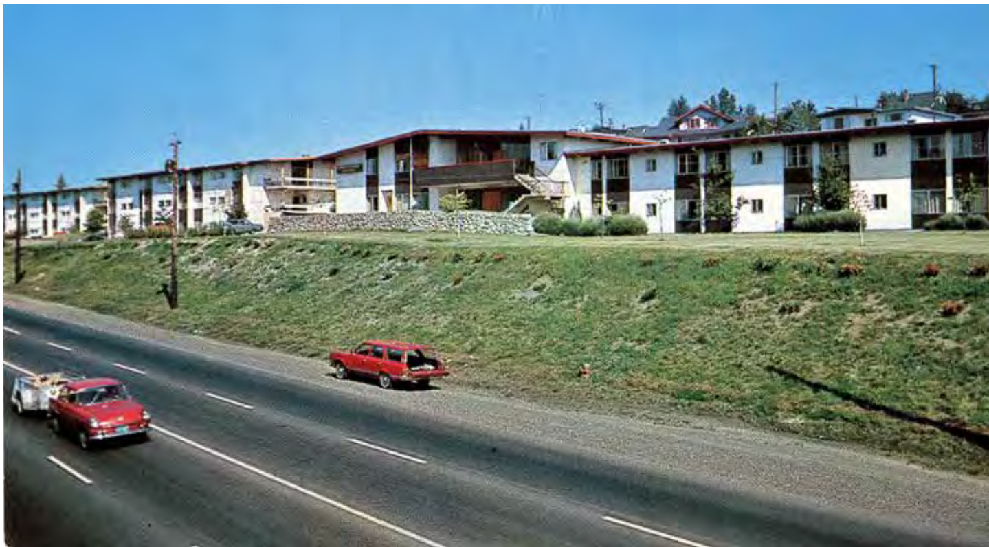
Harrison Drive Old Postcard.

Monet niistä saavutuksista, jotka yhdistys oli saanut aikaan viidenkymmenen vuoden toimintansa aikana, oli seurausta työstä, jolla se mahdollistanut hoitokotivuoteita suomalais-