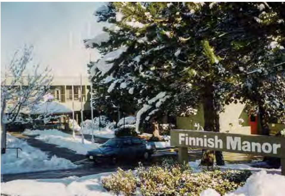
Manor Sign Winter.

Vuosituhannen ensimmäisen vuosikymmenen lähestyessään loppuaan yhdistys tiedosti, että sen resurssit, joihin kohdistui lisääntyvissä määrin monimutkaisia sääntelyvaatimuksia, eivät olleet elinkelpoisia. Kun tilat alunperin avattiin vuonna 1963, asukkaat tulivat tyypillisesti Lepokotiin omin jaloin ja elivät vuosia suhteellisen itsenäisesti. Sitävastoin tämän vuosituhannen aikana asukkaat ovat tavallisimmin saapuneet Lepokotiin ja Finnish Manorille pyörällisin paarein tai pyörätuolissa. Vuosien varrella yhdistyksen toimintojen hoitopalvelupuoli on itse asiassa alkanut muistuttaa sairaalojen toimintoja keskittyessään saattohoitoon, mikä on kaukana alkuperäisestä lepokodista, jossa suomalaiset voisivat asua tiivinä eläkeläisyhteisönä suhteellisen terveinä lukuisia vuosia. Tiivistäen nykyajan vanhustenhoidosta oli tullut monimutkaisempaa kuin alunperin oli kaavailtu. Yhdistyksen oli katsottava tätä realiteettia silmiin tulevana vuosikymmenenä.