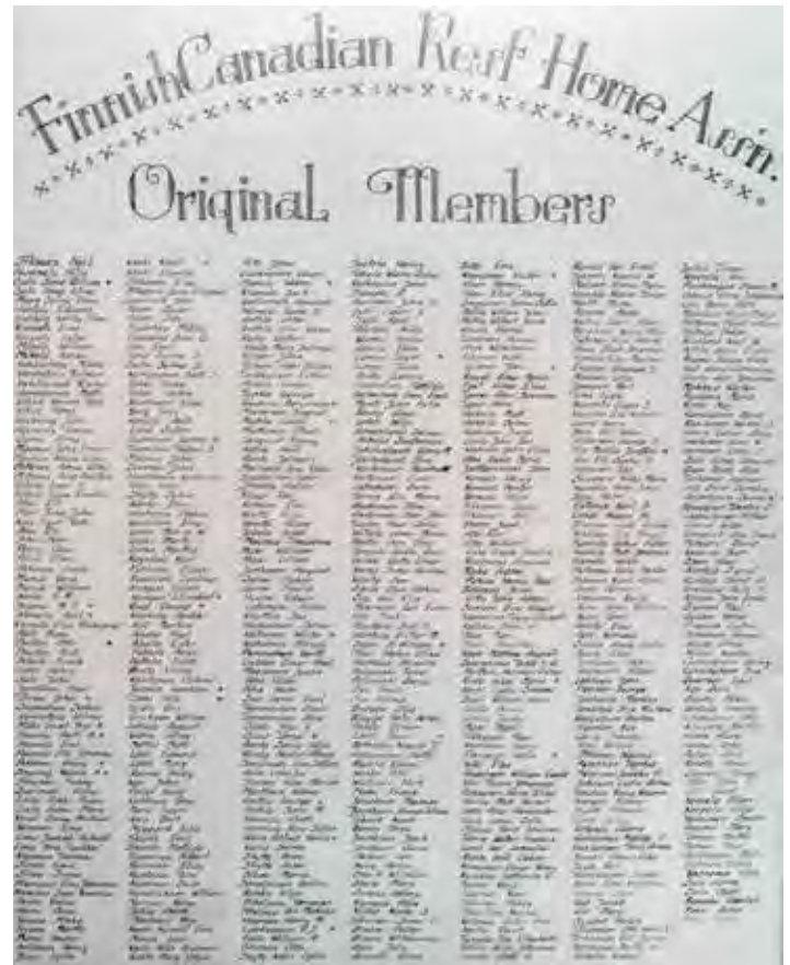
FCRHA List of Original Members.

Loppu hyvin, kaikki hyvin ~ All's well that ends well