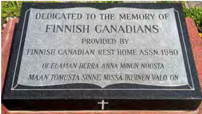
FCRHA Forest Lawn Plaque Close Up