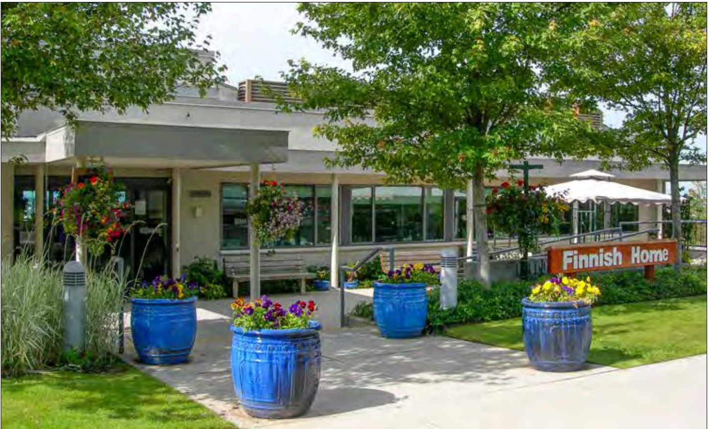
Current Finnish Home front