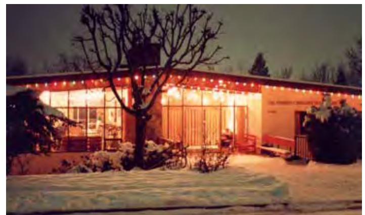
2288 Original Hostel.