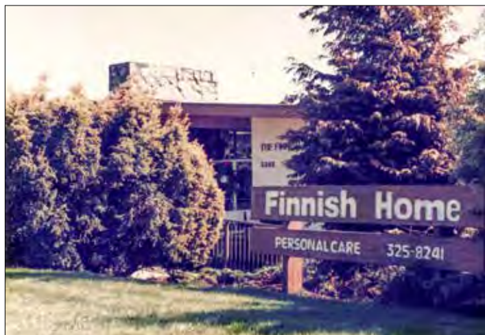
Finnish Home Personal Care 70s on.