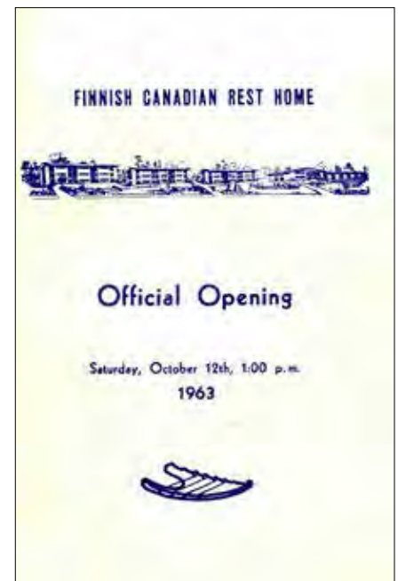
Harrison Opening Program 1963